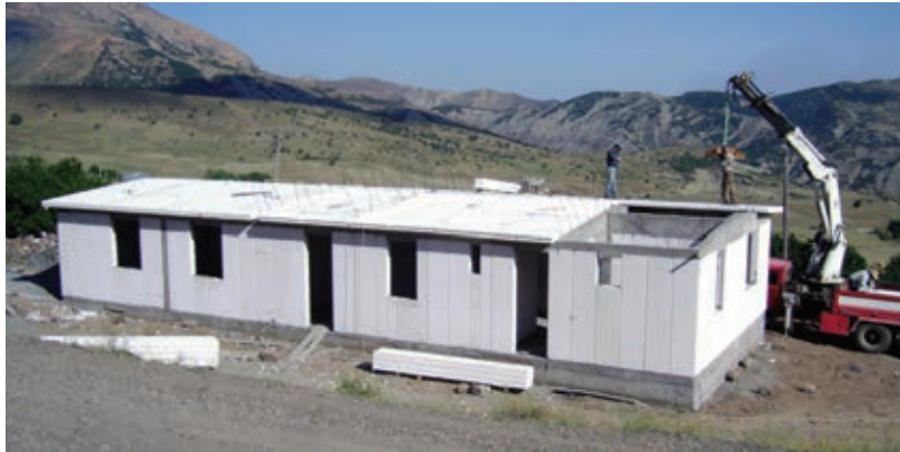
Taşıyıcı Düşey Duvar Elemanları