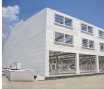
Yatay Duvar Elemanları