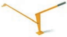
Çatı ve döşeme elemanı sıkıştırma manivelası