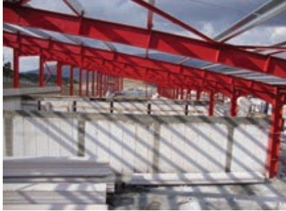
Düşey Duvar Elemanları