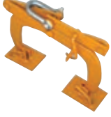
Yatay duvar kavrayıcısı