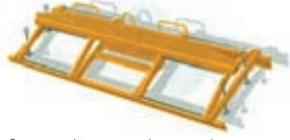
Çatı ve döşeme elemanı kavrayıcısı