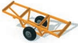
Çatı ve döşeme elemanı montaj arabası