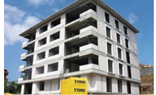
Düşey Duvar Elemanları